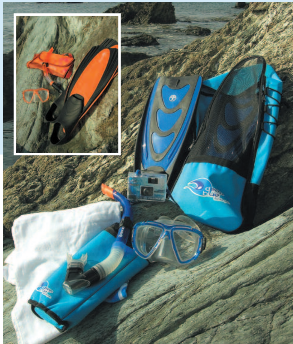
photo jetable pour immortaliser ses premières expéditions, une serviette éponge et une trousse isotherme de bonne facture

Le premier kit est celui que recevront les gagnants de notre jeu concours organisé cet été. Tout confort pour un ensemble en silicone. Les palmes sont bimatières et le chausson élastique et confortable. Les accessoires donnent une petite touche « cadeau », pour une initiation dans les meilleures conditions : un appareil