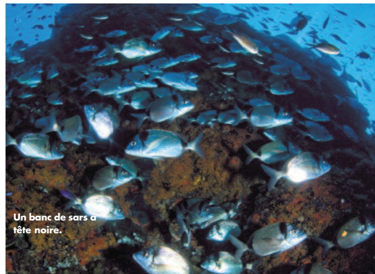
Un banc de sars à tête noire.