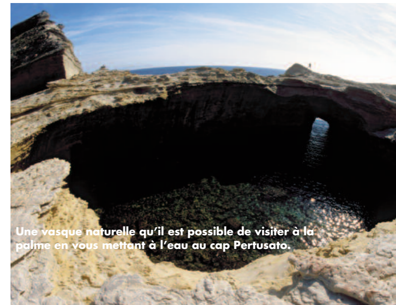
Une vasque naturelle qu'il est possible de visiter à la palme en vous mettant à l'eau au cap Pertusato.